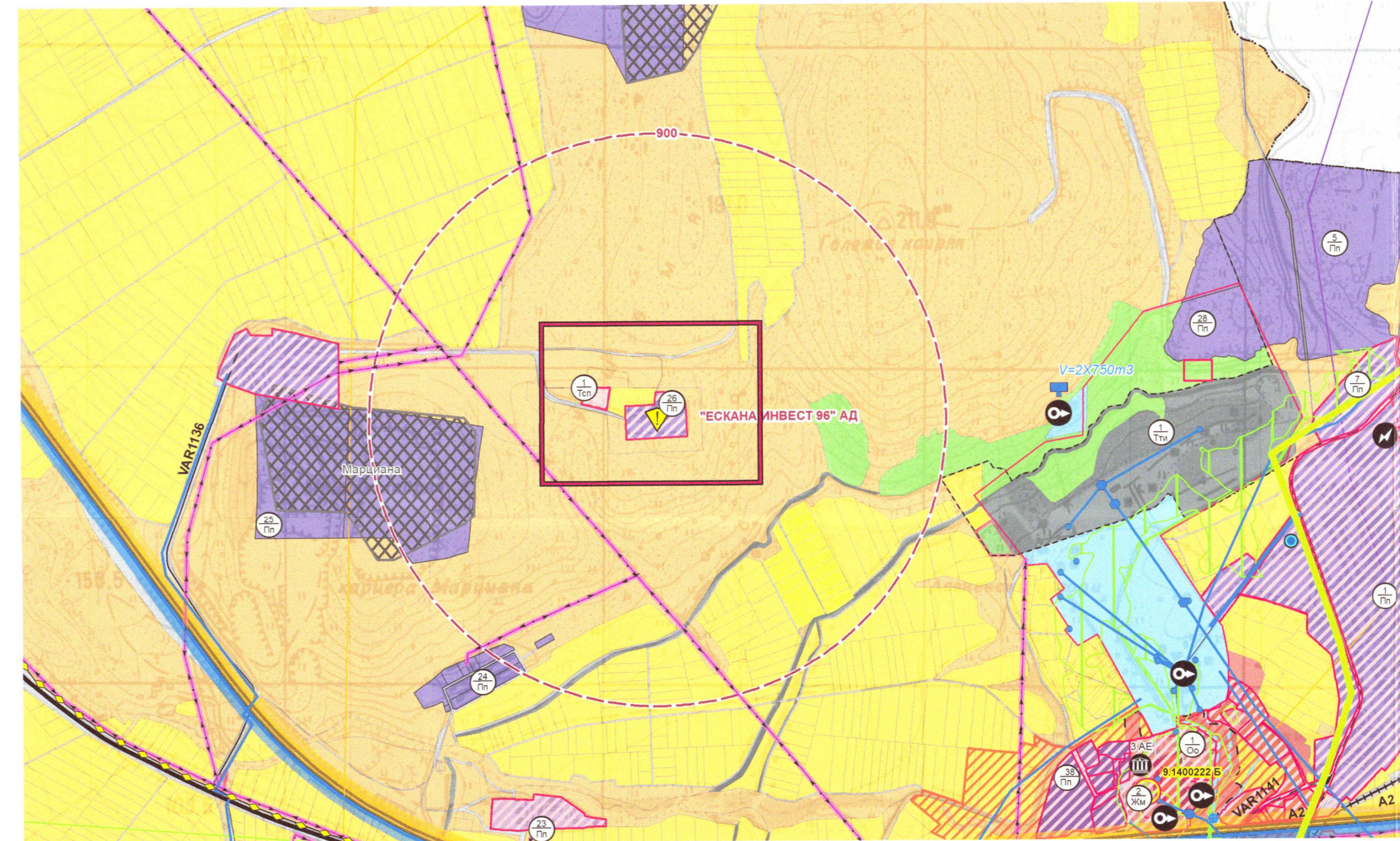
Извадка от ОУП на Община Девня за ПИ 20482.33.115 и ПИ 20482.33.69 / Опорен план /